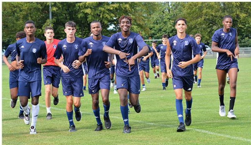
U18 Régional 1