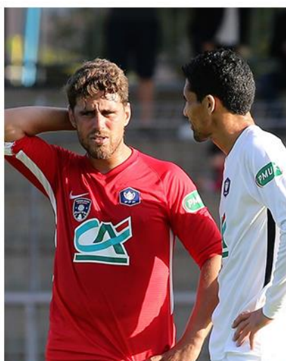
En Coupe de France contre le FC Annecy (2018-2019)