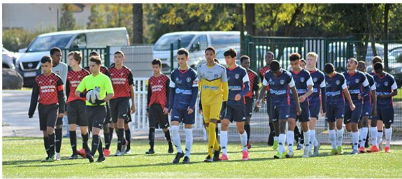
U16 Régional 1

Alors que les U16 et U18 étaient en position délicate après quelques rencontres jouées, l'arrêt des compétitions dû au COVID-19 a permis aux deux équipes de se maintenir au plus haut niveau régional.